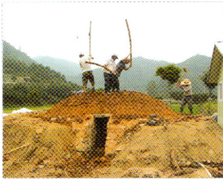
2009년 숲가마 복원과정(인제군 북면 월학리)

“등치기”는 쪽과 진흙을 입힌 숲가마나 지붕을 “메”로 치는 작업 행위이다. 이를테면 숲가마 지붕치기이다.