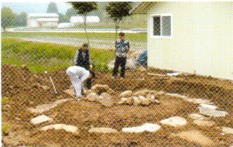
2009년 숲가마 복원과정(인제군 북면 월학리)

인제 숲둔골 숲쟁이들은 숲가마 만들기를 가막박기라고도 일컫는다. 그만큼 가막박기는 숲가마를 만드는 과정에서 중요하다.