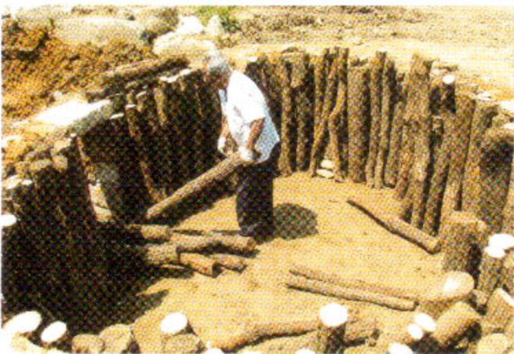
2009년 숯가마 복원과정(인제군 북면 월학리)

가마가 완성되면 나무를 가마 속에 수직으로 세워 넣는다. 가마 중앙에 장찬 나무(제일 크고 좋은 나무)를 세우고 그 주위에 작은 나무들을 세워 넣는다. 작은 가마는 중앙木 6자, 주위木 4~5자, 중가마 중앙木 6.5자~7자, 주위木 4.5자~5.5자, 큰가마는 중앙木 8자~8.5자, 주위木 5.5자~6.5자 내외 짜리를 세워 넣는다.