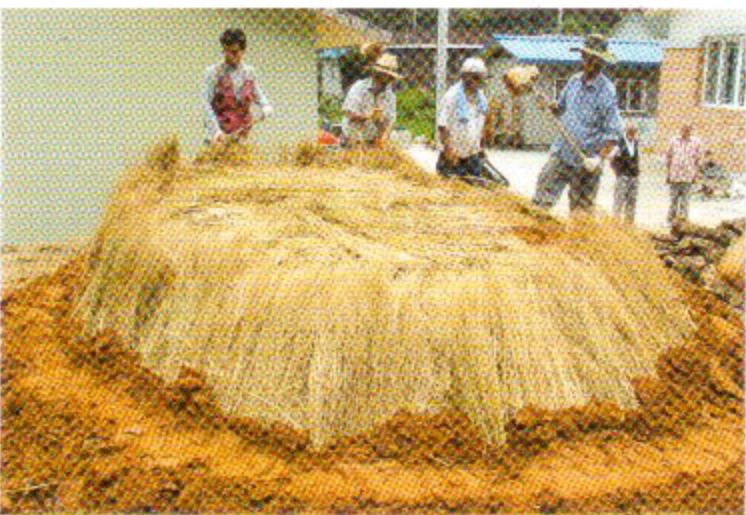
2009년 숯가마 복원과정(인제군 북면 월학리)

한 가마 굽기의 나무량은 작은가마는 30짐, 중가마는 80짐, 큰가마는 200짐 내외가 소요된다. 소요되는 나무를 개수로 치지 않고 <짐>으로 셈한다. 밀어도 쓰러지지 않도록 뻑뻑하게 나무를 세워 넣고 이리저리 밀어 본다. 흔들리거나 틈이 보이는 곳에는 작은 나무를 끼워 넣고 썰기도 박는 등 보완작업을 한다.