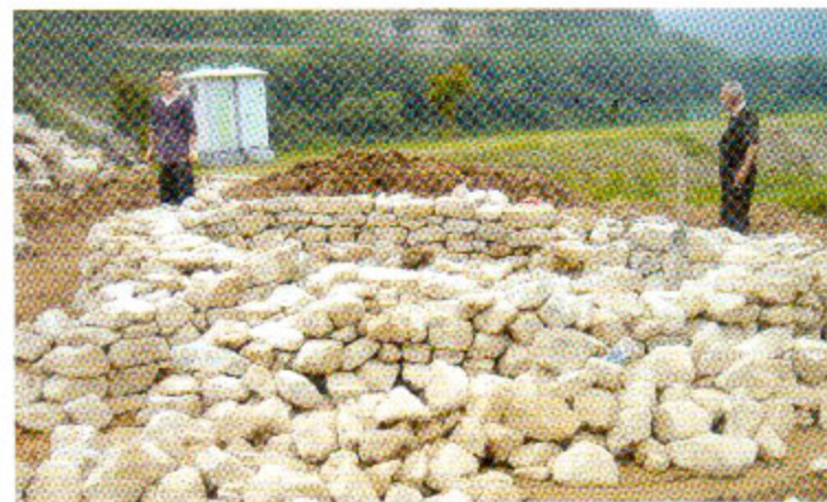
2009년 숲가마 복원과정(인제군 북면 월학리)